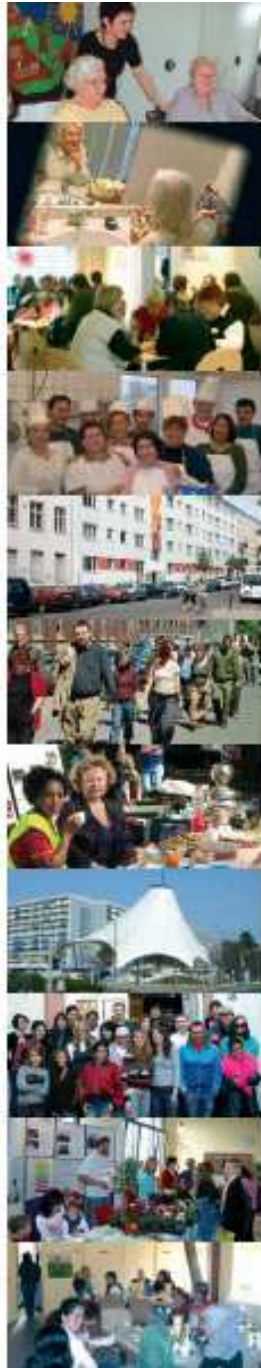
Preis Soziale Stadt 2006 Dokumentation