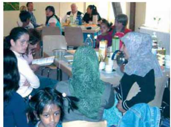
Die Elternbildungsarbeit erfolgt in Eltern-/Müttergruppen, die nicht von Profis, sondern von dafür ausgebildeten engagierten „Stadtteil-müttern“ aus dem jeweiligen Kulturkreis der Gruppenmitglieder auf Honorarbasis geleitet werden.

Sonderpreis: „Kinder und Jugend in der Sozialen Stadt“