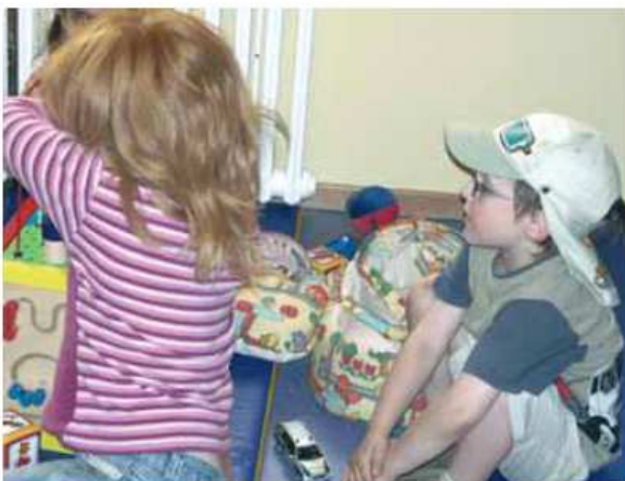
Langfristiges Ziel ist ein ganzheitliches Programm – die Einbindung von stadtteilweit allen Kindertagesstätten, Grundschulen und sonstigen Institutionen, die sich im Quartier an die Eltern und Kinder wenden