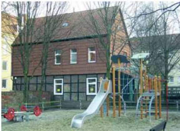
Das neue Familienhaus als Ort für die Programme für Eltern von 0-3-jährigen Kindern – ideal neben einem vorhandenen Spielplatz gelegen