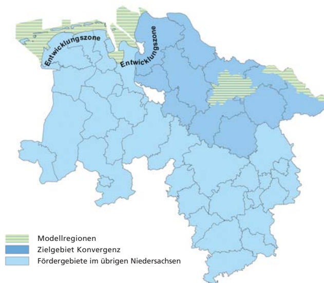
Karte 2: Fördergebiete Nachhaltigkeit