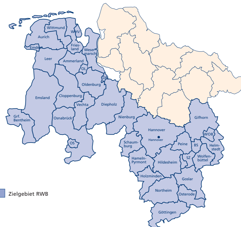
Niedersächsische Zielgebietskarte RWB bestehend aus den Regionen Braunschweig, Hannover und Weser-Ems

Beteiligung der Wirtschafts- und Sozialpartner